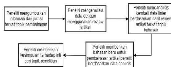
Gambar 1. Langkah-langkah Penelitian Kajian Pustaka

perencanaan penelitian. Metode ini memungkinkan peneliti untuk mengumpulkan data awal yang relevan dengan topik penelitian tanpa harus langsung ke lapangan. Gambar 1 menunjukkan skema langkah-langkah penelitian: